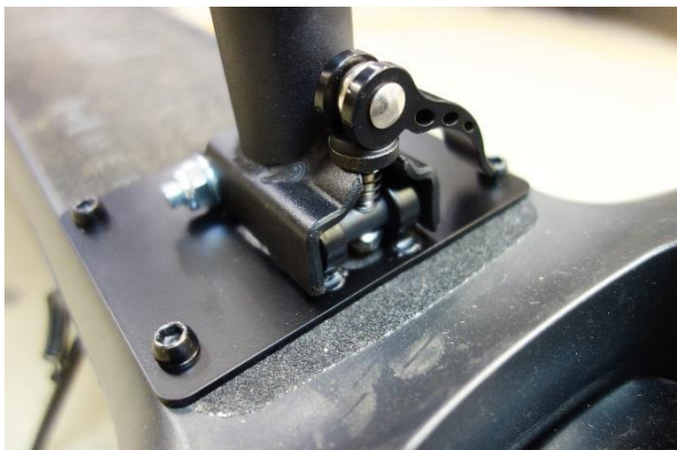
Umiestnenie základne na nášľapnej ploche elektro kolobežky a uzamknutý rýchlopínací mechanizmus.