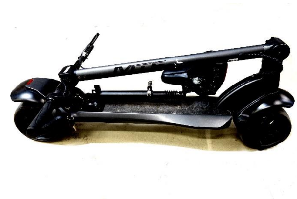
zložená elektro kolobežka so zloženým sedlom.