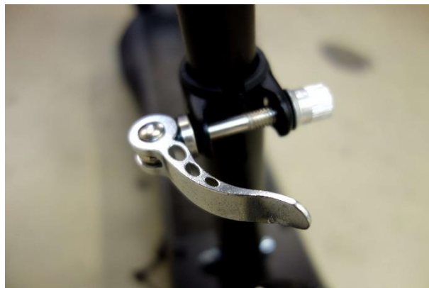
Rychloupínací šroub objímky na sedlové trubce.