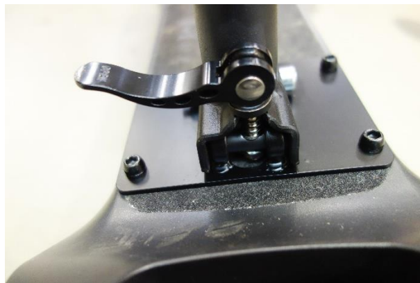
Zaháknutý rychloupínací mechanismus před dotáhnutím.