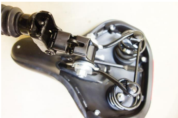
Sklopené sedlo s páčkou aretácie nakláňania sedla a skrutka nastavenia sklonu sedla